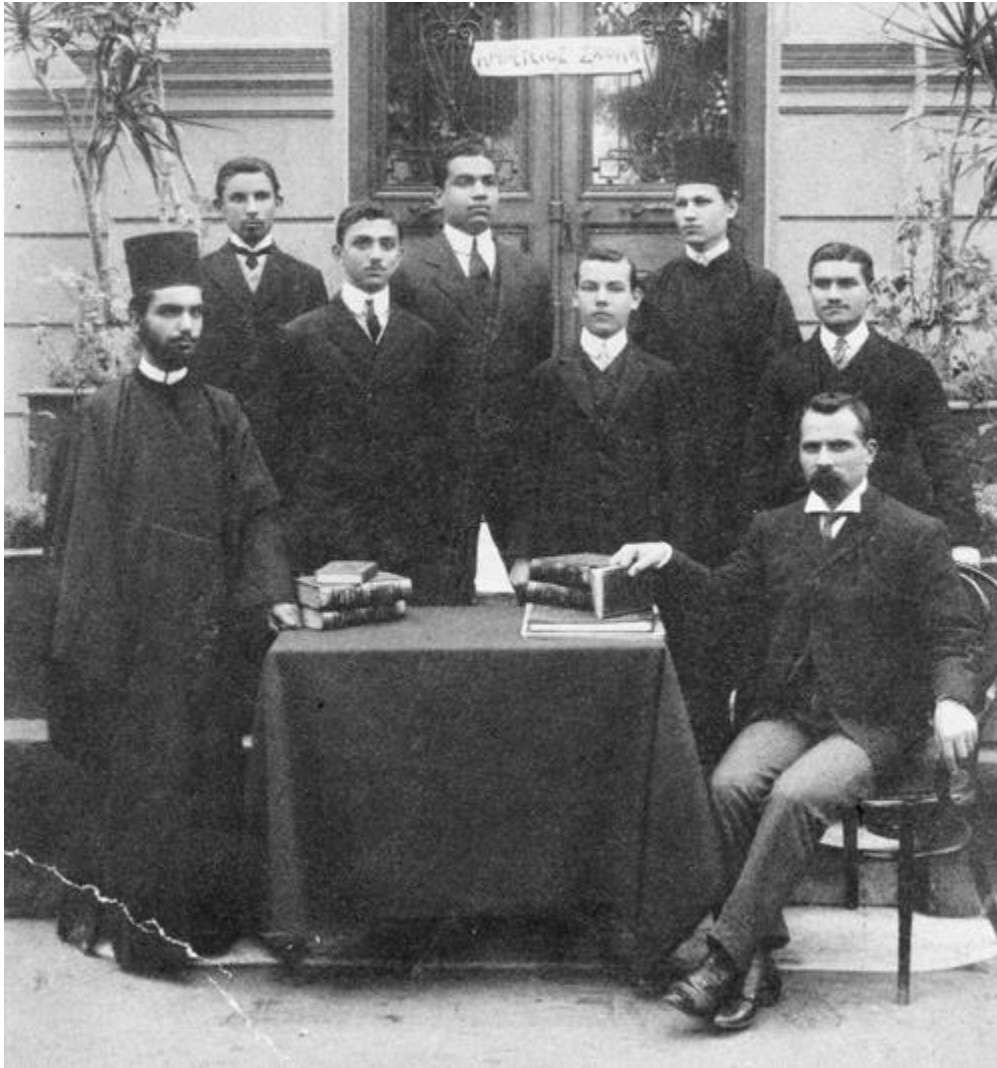
Ο Μοσχίδης με μαθητές του στην Αμπετέιο Σχολή

Το 1905 παντρεύτηκε τη Φιλίτσα Τενεκίδου από τα Βουρλά, η οποία ήταν πρώτη εξαδέλφη της μητέρας του ποιητή Γιώργου Σεφέρη. Το ίδιο έτος μετακόμισε στην Αλεξάνδρεια της Αιγύπτου, για να εργαστεί στο Αβερώφειο Γυμνάσιο. Το 1908 ανέλαβε διευθυντής της Αμπετείου Σχολής Καΐρου. Στο Κάιρο πέθανε ξαφνικά το 1912, μετά από μία κρίση σκληροκοιδίτιδας και μια αποτυχημένη επέμβαση.